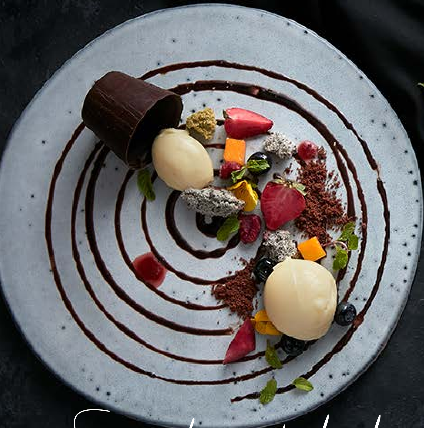
Signature discovery chocolate platter Món đặc biệt của Chef 155.000