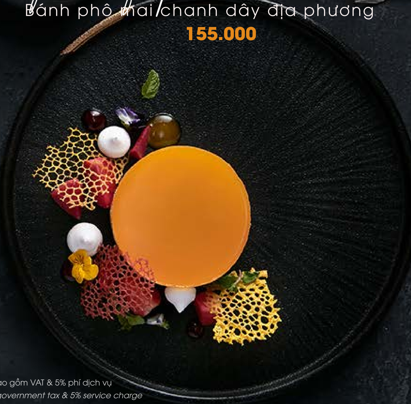
Passion fruit cold cheese cake Bánh phô mai chanh dây địa phương 155.000